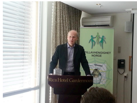
Michael Tetzschner fra Høyre.