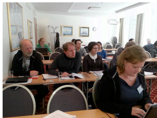
Noen av vår engasjerte.