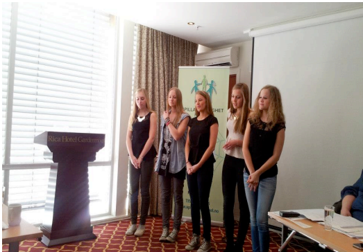
5 fantastiske jenter synger acapella

I tillegg forsøker vi alltid å ha med et lokalt kulturelt innslag. I tillegg hadde Norsk Tipping en kort orientering.