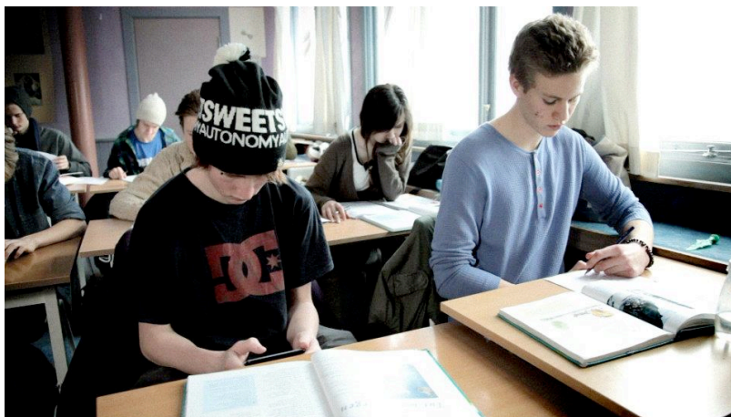
Stillbilde fra spotfilmen, under seksjon ungdom og spill.