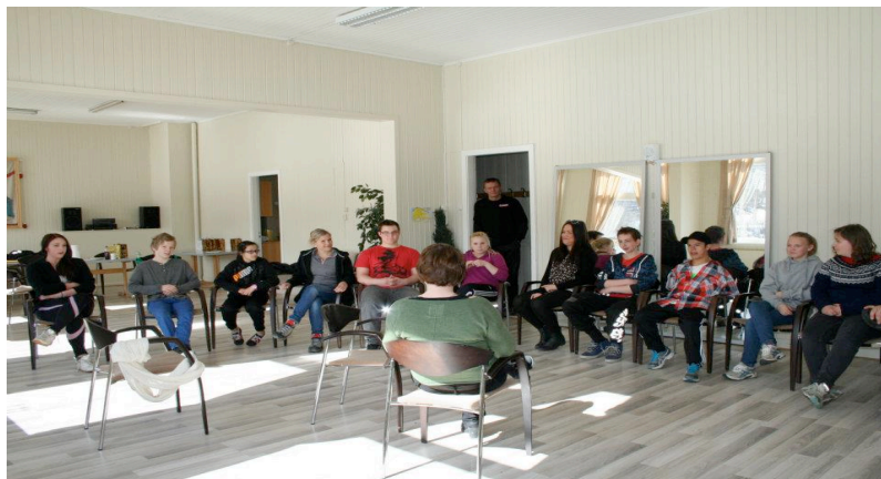
Bilde fra aktivitetdagen.

Styret i Spillavhengighet Norge hadde forventet en del oppstartsproblemer når vi vedtok å ha et ungdomsteam. Det er et nytt arbeid, og det er viktig å finne den rette arbeidsformen til dette arbeidet.