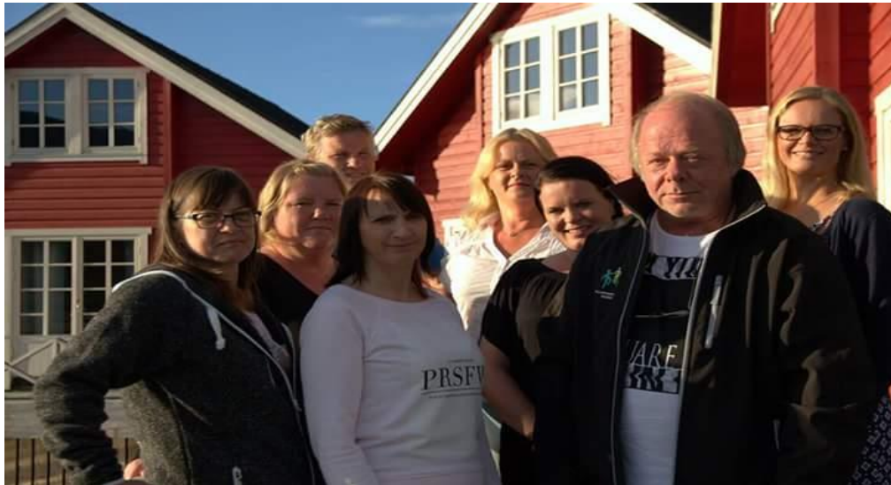
Deler av styret i Spillavhengighet Norge

Det er skrevet en egen rapport for kompetansehevingstiltakene som legges ved denne rapporten.