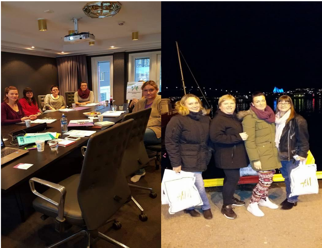
Bilder fra samlingen med nye og gamle engasjerte.

I 2016 vil det bli arrangert en liknende samling. Da deles den i 2 deler. En del for nye og en del for viderekommende. Dette fordi det alltid er behov for innputt og opplæring ved jevne mellomrom for alle som er med i organisasjonen.