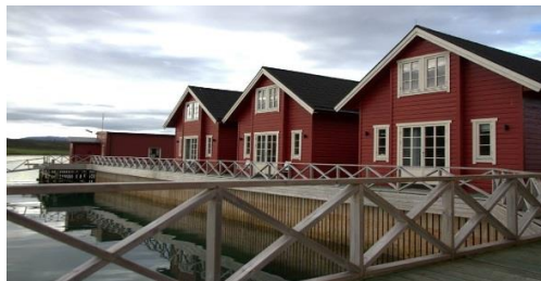
Her bodde de engasjerte under opplæringen. Lyngen havfiske og tursenter.

Tilbakemeldingene etter samlingen var svært positive. Dette er noe som lenge har vært ønsket, men ikke blitt prioritert. Vi vil derfor i fremtiden ha mer fokus på å kunne ha denne type opplæring med jevne mellomrom.