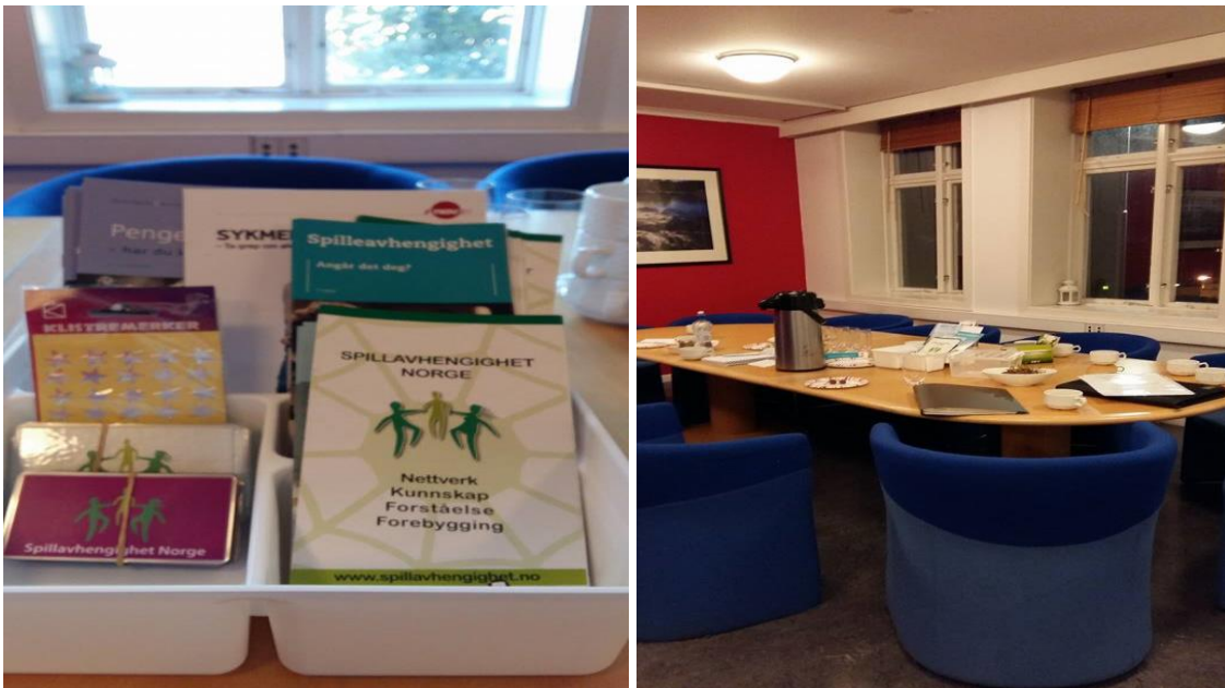
Bilder tatt fra gruppelokalene i Bergen.

Møtene drives av møteleder. For at noen ikke skal få for stor belastning, så er det frivillig å være møteleder. Det rulleres også på å være møteleder. Regelen er at en velges som møteleder for en periode.